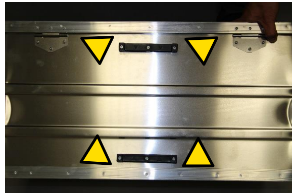
Oberen Halter mit Pfeilrichtung nach unten montieren.