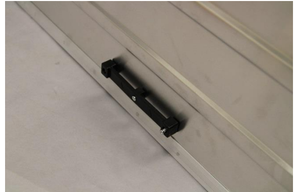
Unteren Halter mit Pfeilrichtung nach oben montieren.