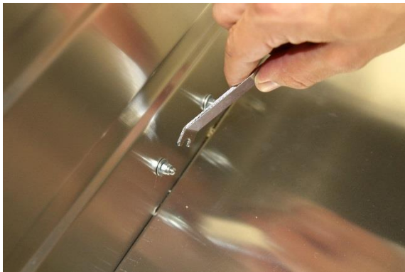
Schrauben mit Muttern und Unterlegscheiben sichern.