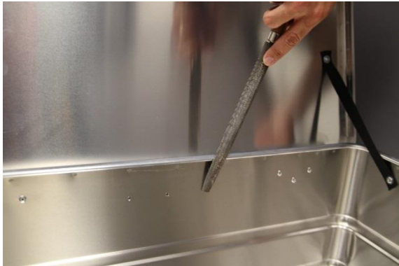
Mit Feile Bohrlöcher entgraten.